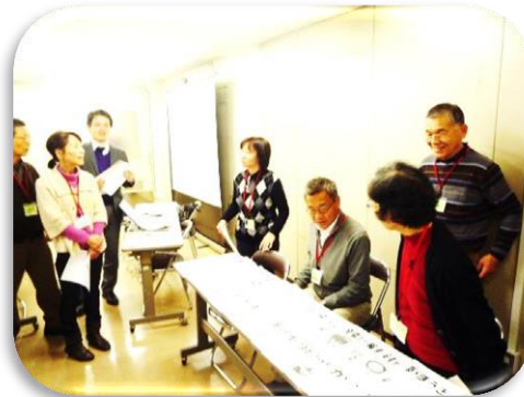
ボランティアセンター運営委員による訓練の様子