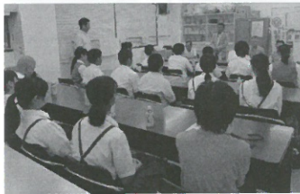
駅頭キャンペーンの反省会