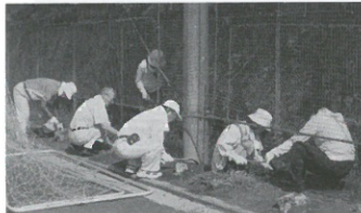
暑い中、校庭での草取り