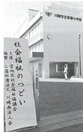
社会福祉のつどい 主催 菅地区社会福祉協議会 協賛 公益社団法人 川崎西法人会

平成29年11月25日(土)東菅小学校アリーナにて快晴の中「第12回社会福祉のつどい」が開催されました。第一部の式典は、協賛の川崎西法人会を始め多摩区より多数の来賓をお迎えし盛大に行われました。第二部の演芸では、菅地区の小学校、中学校、高等学校の児童、生徒の皆さん、また社会福祉法人や町会関連部会、長