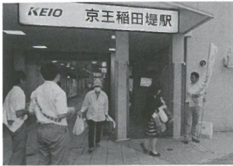
京王稲田堤駅頭での声かけ

No.28 発行人/菅地区社会福祉協議会 発行人/大澤敏夫 編集人/五嶋庸成 事務局/川崎市多摩区登戸1763 ライフガーデン向ヶ丘2階 福祉パル内 TEL.044-935-5500