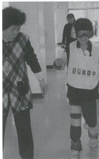
高齢者の疑似体験

平成29年9月27日(水)午後4時からJR稲田堤駅・京王稲田堤駅の駅頭において、キャンペーン活動を行いました。当日は、菅中学校、南菅中学校の生徒15名と教師2名および菅地区社会福祉協議会理事が参加して、「社会を明