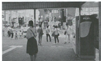
JR稲田堤駅頭での声かけ