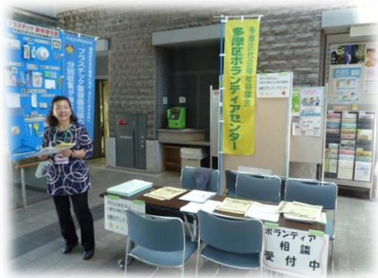
多摩区役所1階(パサージュ・たま)での様子

ボランティアに関して何か聞きたいことがある方は、お気軽に顔を出してみてください♪