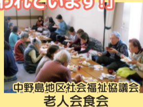
中野島地区社会福祉協議会 老人会会食