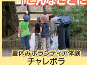
夏休みボランティア体験 チャレボラ