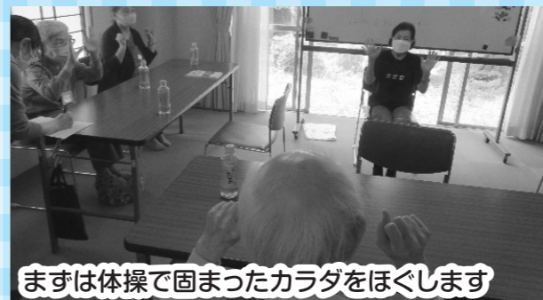
まずは体操で固まったカラダをほぐします