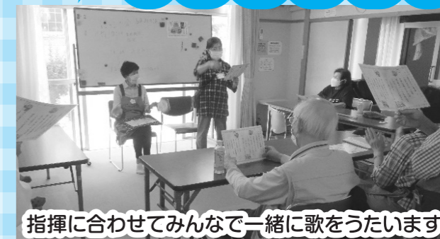
指揮に合わせてみんなで一緒に歌をうたいます