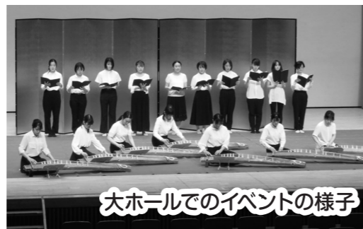
大ホールでのイベントの様子