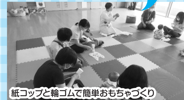
紙コップと輪ゴムで簡単おもちゃづくり

※この他にも地区社会福祉協議会や地区民生委員児童委員協議会、ボランティア団体で活動を再開しているサロンやミニデイがあります。