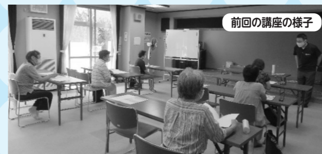
前回の講座の様子