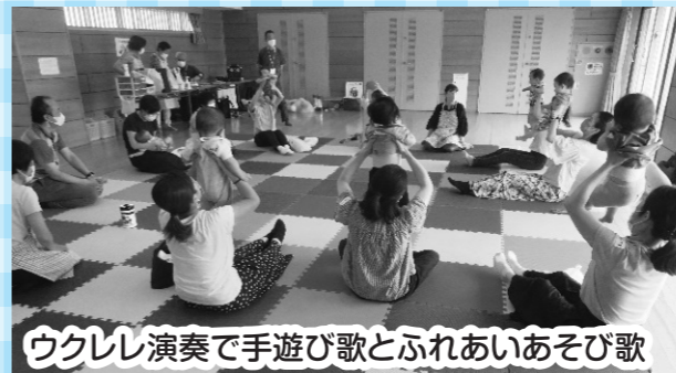
ウクレレ演奏で手遊び歌とふれあいあそび歌