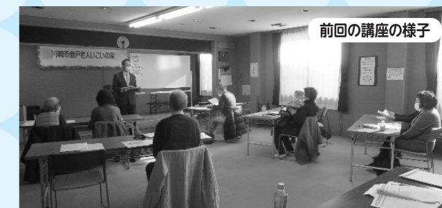
前回の講座の様子