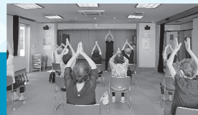
南菅・長尾・中野島・枡形・登戸・菅 「コグニサイズで認知症予防」