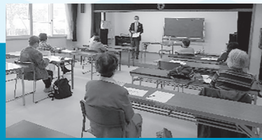
錦ヶ丘・南菅 「終活って なんだろう!」

高齢者の社会参加の意欲向上や介護予防、認知症予防に加え、老人いこいの家を地域住民の皆様に広く知っていただくことを目的として下記の公開講座を開催しました。