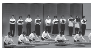
(大会議室でのイベントの様子) ※令和4年度

障がいのある方々の活動に関心のある方、ボランティア活動に関心のある方、一緒に楽しく素敵なおまつりを作り上げましょう。 高校生以上の方ならどなたでも大歓迎です。