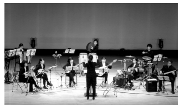
(大ホールでのイベントの様子) 明治大学マンドリン倶楽部