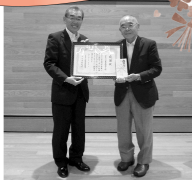
<<写真>>セレサ川崎農業協同組合寄附贈呈式(令和5年6月31日)