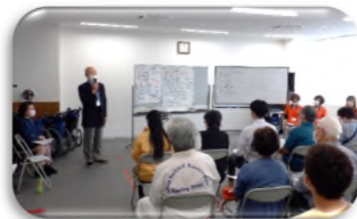
↑ ボランティア入門講座開催の様子