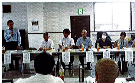
小学校4校の校長・PTA会長