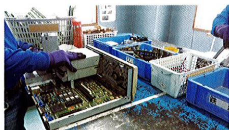
電気製品の部品取り外し作業