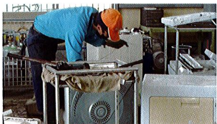
家電製品の解体作業