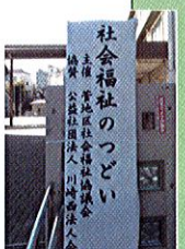
東菅小学校・正門