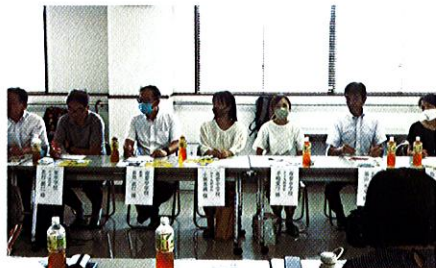
中学校2校, 高等学校の校長・PTA会長