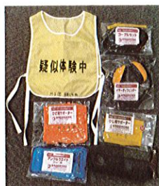
福祉教育用品の貸出し