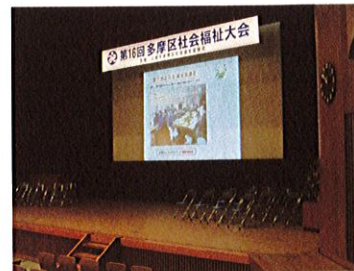
多摩区社会福祉大会